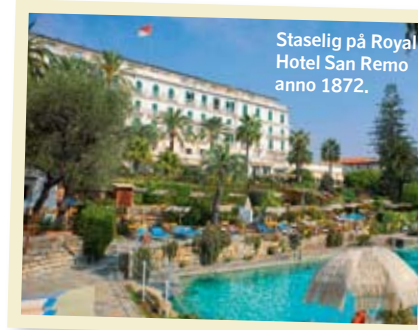
Staselig på Royal Hotel San Remo anno 1872.

Vi ønsker dere en riktig god ferie, vennlig hilsen redaksjonen.